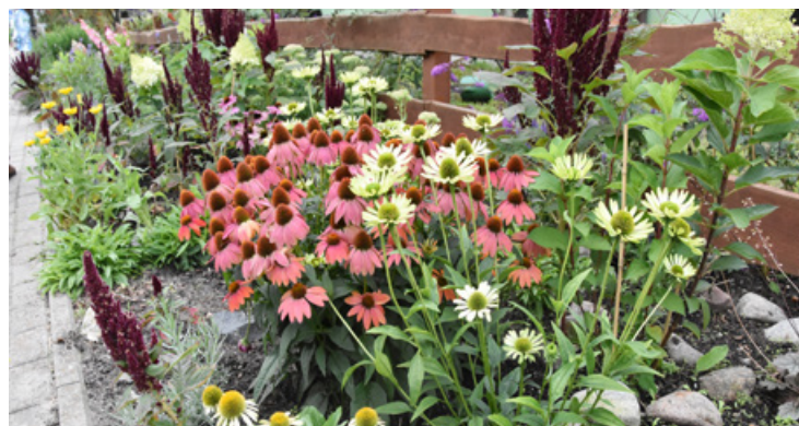
II MIEJSCE MORAWA – nagroda w wysokości 4 000,00 zł