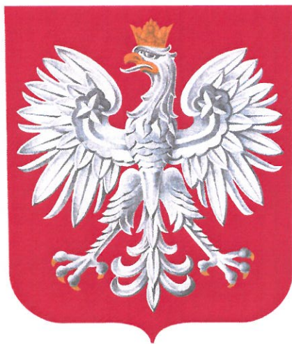
WOJEWODA WARMIŃSKO-MAZURSKI ARTUR CHOJECKI