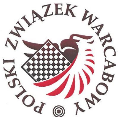
WARMIŃSKO-MAZURSKI OKRĘGOWY ZWIĄZEK WARCABOWY